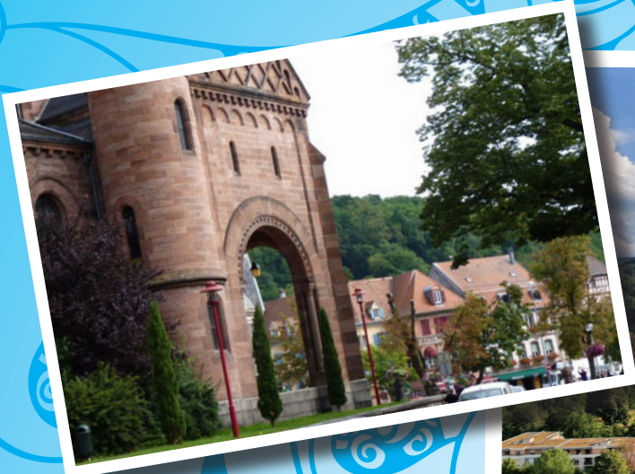
Munster en Alsace