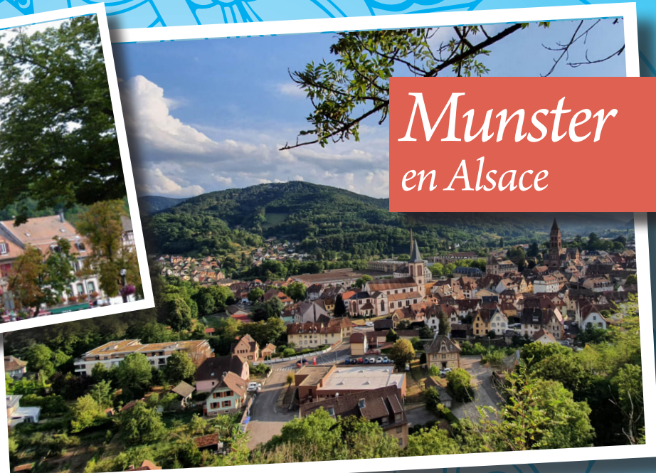
Munster en Alsace